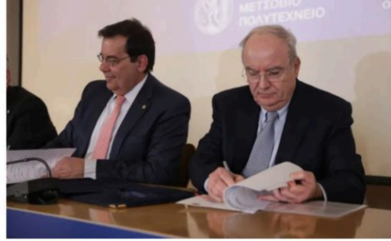
Ο Πρόεδρος και Διευθύνων Σύμβουλος του Ομίλου ΓΕΚ ΤΕΡΝΑ, κ. Γιώργος Περιστέρης και ο Πρόεδρος του ΕΜΠ κ. Ανδρέας Μπιστουζής κατά την εκδήλη υπογραφής της σύμπραξης για το πρώτο Επαγγελματικό Μεταπτυχιακό Πρόγραμμα Σπουδών «Διαχείριση Έργων Υποδομών και Κατασκευών».

Επιπλέον, το μεταπτυχιακό θα αφορά 30 πτυχιούχους κάθε ακαδημαϊκή χρονιά, ενώ αριωγός στην ανάπτυξη του πρώτου επαγγελματικού μεταπτυχιακού στην Ελλάδα θα είναι και το Εθνικό Συμβούλιο Βιομηχανίας Υποδομών και Κατασκευών.