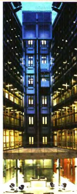
▶ ΣΤΙΣ 15 ΦΕΒΡΟΥΑΡΙΟΥ ΠΑΡΟΥΣΙΑΣΤΗΚΕ ΤΟ ΕΔΠΜΣ-ΔΕΥΚ, ΣΤΟ ΟΠΟΙΟ ΓΙΑ ΠΡΩΤΗ ΦΟΡΑ ΙΔΙΟΤΙΚΕΣ ΚΑΙ ΑΝΩΤΑΤΗ ΕΚΠΑΙΔΕΥΣΗ ΕΡΧΟΝΤΑΙ ΠΙΟ ΚΟΝΤΑ ΜΕ ΣΥΜΠΡΑΞΗ.

περιοχή της "Διαχείρισης Έργων Υποδομών και Κατασκευών". Σκοπός του είναι η ειδικευση στελεχών νέων διπλωματούχων μηχανικών, αποφοίτων ΑΕΙ της ημεδαπής, με πενταετή διάρκεια σπουδών, στις σύγχρονες μεθόδους και τεχνικές της διαχείρισης έργων υποδομών και κατασκευών, με έμφαση στις απαραίτητες τεχνικές και διοικητικές δεξιότητες για την ορθολογική υλοποίηση υποδομών. Το ΕΔΠΜΣ-ΔΕΥΚ απονέμει Δίπλωμα Μεταπτυχιακών Σπουδών (ΔΜΣ), ισότιμο προς πτυχίο Master of Science (MSc), στην περιοχή της Διαχείρισης Έργων Υποδομών και Κατασκευών (Infrastructure and Construction Project Management) έπειτα από επιτυχή περάτωση του σχετικού κύκλου σπουδών.